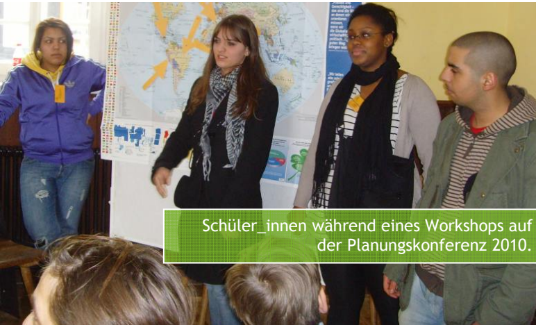
Schüler_innen während eines Workshops auf der Planungskonferenz 2010.

Die Schüler_innen erwerben im Programm sachliches entwicklungspolitisches Wissen und Gestaltungskompetenzen, wobei die Auseinandersetzung mit der eigenen Lebenswelt und der Gewinn von inter- und transkulturellen Erfahrungen von den Teilnehmenden 2006, 2007 und 2008 als zentrale Kompetenzen genannt werden.