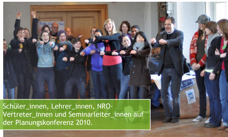
Schüler_innen, Lehrer_innen, NRO-Vertreter_innen und Seminarleiter_innen auf der Planungskonferenz 2010.