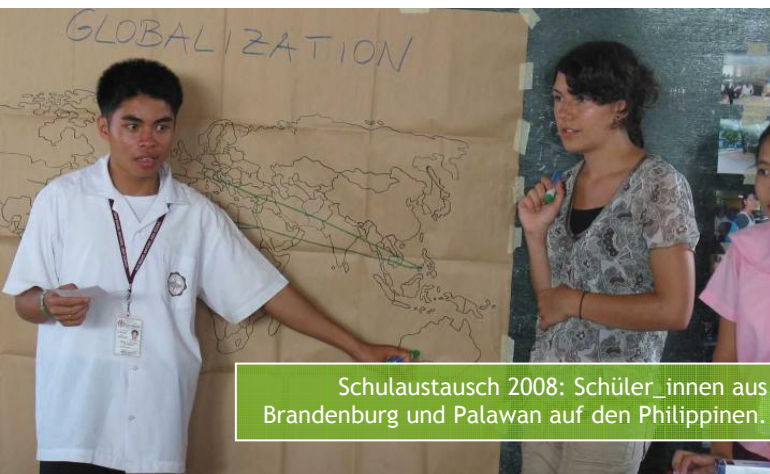
Schulaustausch 2008: Schüler_innen aus Brandenburg und Palawan auf den Philippinen.