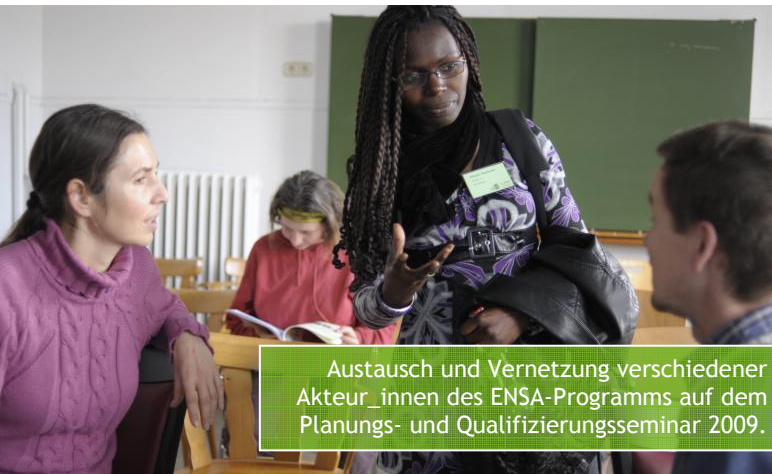
Austausch und Vernetzung verschiedener Akteur_innen des ENSA-Programms auf dem Planungs- und Qualifizierungsseminar 2009.

Entwicklung“) anzuknüpfen und den föderalen und regionalen Charakter von Bildung (Bildungsadministration, Schulen) im Auge zu behalten.